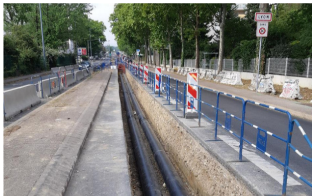
Chantier d'extension du réseau de chaleur Ouest Lyonnais vers Champagne-au-Mont-d'Or

4 km de canalisations supplémentaires ont été créées pour desservir la commune de Champagne-au-Mont-d'Or et le quartier des Sources à Écully.